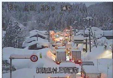
H30. 2. 6