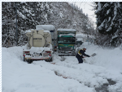
H30. 2. 6