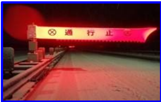
《エア遮断機による通行止め規制状況》